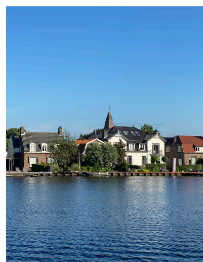
UITHOORN AAN DE AMSTEL